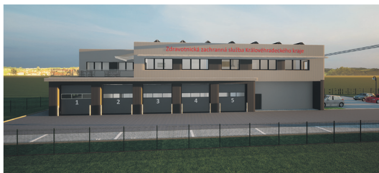
Vizualizace nové základny Zdravotnické záchranné služby KHK u Jičína.

V tomto roce kraj plánuje zahájit stavbu nového parkovacího domu v trutnovské nemocnici s kapacitou 320 parkovacích míst za zhruba 190 milionů korun. V Trutnově kraj bude letos také pokračovat v dostavbě konsolidovaných laboratoří za 175 milionů korun.