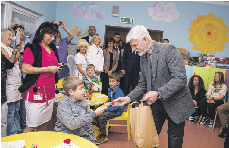
Petr Pavel s manželkou Evou začal svou pracovní cestu po Královéhradeckém kraji v Dětské klinice Fakultní nemocnice Hradec Králové.

Prezident republiky Petr Pavel navštívil na začátku prosince loňského roku Královéhradecký kraj. Během dvoudenní pracovní cesty jednal nejen s vedením kraje, ale setkal se i se starosty obcí na Broumovsku a Náchodsku a navštívil dětské pacienty ve fakultní nemocnici i vojáky v Dobrušce.