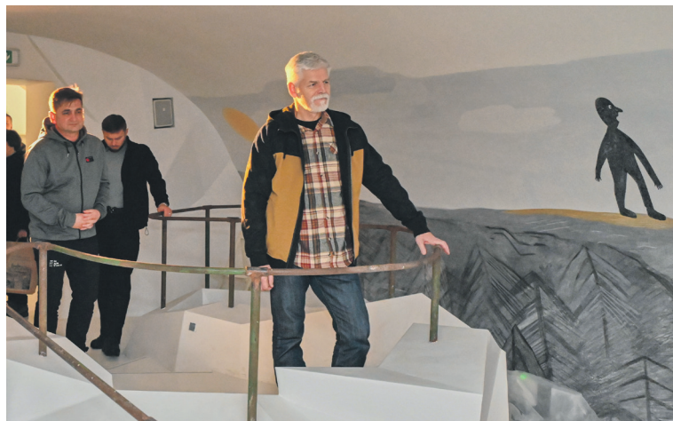
Na závěr cesty záměřil Petr Pavel do nedávno otevřeného Návštěvního centra Krkonošského národního parku - Muzea Krkonoš ve Vrchlabí. Prezident si nejprve prohlédl moderní expozici a poté debatoval se starosty obcí ležících na území KRNPu.