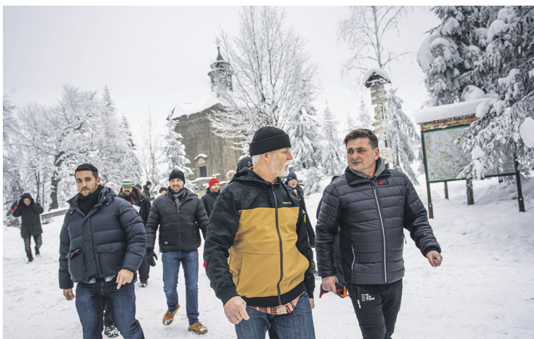
Zpestřením programu druhého dne návštěvy prezidenta Pavla v Královéhradeckém kraji byla procházka zasněženými Broumovskými stěnami v okolí chaty Hvězda.