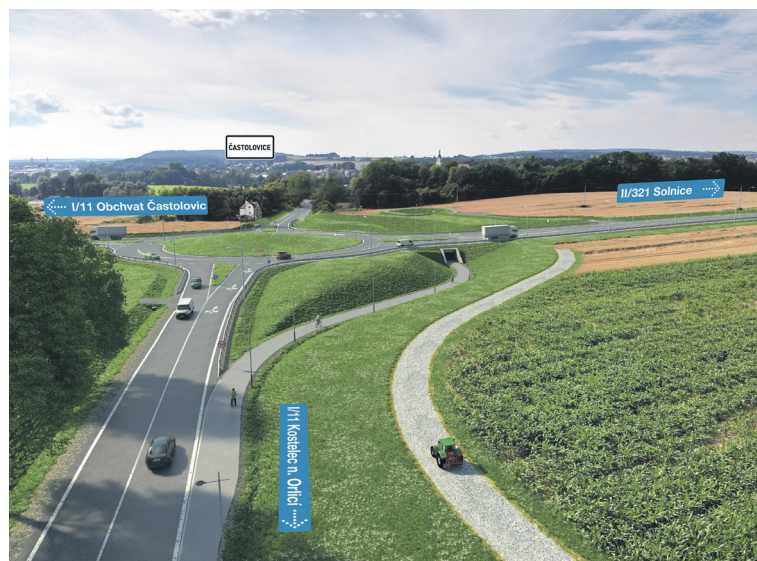
Vizualizace okružní křižovatky u Častolovic.

Zvýšit standard poskytované péče hodlá kraj v příštím roce v Domově pro seniory Vrchlabí. Připravuje stavbu nového domova se zvláštním režimem pro seniory s demencí o celkové kapacitě 34 lůžek. Projekt má hotovou projektovou dokumentaci pro provádění stavby a zajištěné pravomocné stavební povolení. Nyní kraj hledá zhotovitele s tím, že začít stavět plánuje v dubnu 2024. Předpokládaná cena včetně vybavení je 365 milionů korun včetně DPH, přičemž 80 milionů korun by mohl přispět stát.