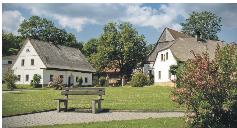
Suchý Důl, Vesnice Královéhradeckého kraje roku 2023.

stupitelstvu. Je to ocenění všech, kterým není život v obci lhostejný, kteří pro ni pracují a vynakládají nemalé úsilí, aby se nám tu dobře žilo. Velký díl patří všem spolkům,