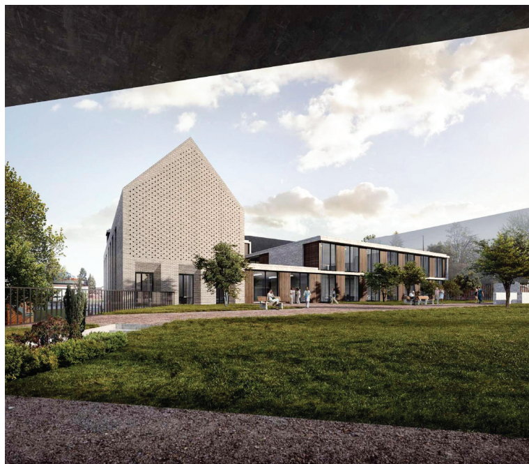
Vizualizace budoucí podoby nového pavilonu psychiatrie.

„Plánujeme v Jičíně postavit nový pavilon psychiatrie. Vznikne na místě stávajících nemocničních budov ležících naproti areálu nemocnice přes Bolzanovu ulici. V novém pavilonu vznikne celkem 43 lůžek pro akutně i plánovaně přijímané pacienty, čímž se téměř ztrojnásobí kapacita oddělení. V současné chvíli je zde k dispozici pouze 15 lůžek. Součástí projektu jsou i dvě podzemní podlaží, kde bude parkoviště pro 185 vozidel. Touto cestou chceme pomoci s řešením nedostatku parkovacích míst v areálu i blízkém okolí